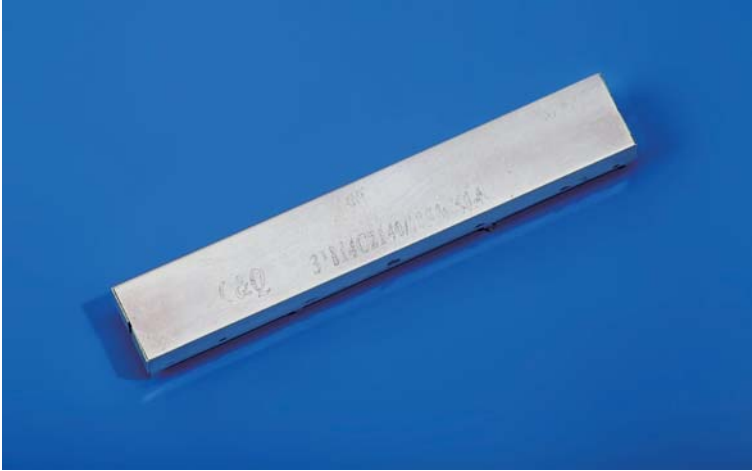
Dimension (尺寸) ( Unit:mm )

-For wireless communication equipment such as base station, repeater etc. -适用于基站、直放站等无线通信设备。